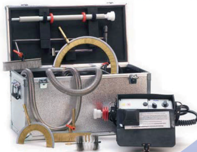
Selezione dell'ampia offerta di accessori